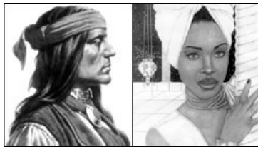
Ethische buitenaardsen inspireerden de inheemsen

De kennis van astrologische feiten binnen de verschillende gemeenschappen in stamverband wordt in verband gebracht met beweringen over buitenaards contact, lang voor de moderne astronomie; voorts bekrachtigd door de uitspraken van de exo-geleerden over bewijs van buitenaardse contact in het menselijk DNA.