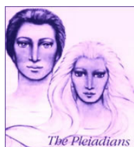
Mensen van de Pleiaden, in het sterrenbeeld Stier, 500 lichtjaren van de aarde