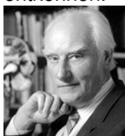
Dr. Francis Crick: Buitenaardse oorsprong in het menselijk genoom

Deze psychokinetische vermogens kunnen bijvoorbeeld zo nu en dan zichtbaar worden, wanneer menselijke wezens, als ze trachten het leven van een ander te redden, "grote fysieke krachten en andere handelingen" uitoefenen die het begrip van de officiële wetenschap te boven gaan. De vastgelegde, genezende vermogens die bepaalde personen, in bijvoorbeeld inheemse gemeenschappen over de hele wereld, in samenhang met hun spiritualiteit hebben gedemonstreerd, welke ook van Jezus vermeld worden, kunnen beschouwd worden als het verkrijgen van toegang tot dit DNA geheugen. De officiële wetenschap, die tracht de belangen aan te vullen van de verschillende maatschappijen welke erop uit zijn om bedrijfsmatig te profiteren van geneesmiddelen en andere therapieën, heeft duidelijk getracht de ontzagwekkende mogelijkheden van de mensheid voor een verheven kwaliteit van leven, door het verkrijgen van toegang tot het buitenaardse DNA geheugen, te ontkennen.