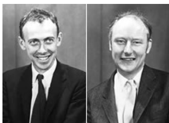
Francis Crick en medewerker James Watson

Trouwens, de pogingen om een wetenschappelijke context te vinden voor het begrijpen van spirituele verschijnselen, worden ook afgekeurd door de elite van de gevestigde godsdiensten, die graag de "officiële wetenschap" aanhouden om gezag over de mensheid te kunnen uitoefenen binnen de systemen van de geaccepteerde doctrines en dogma's.