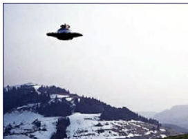
Ruimteschip van de Pleiaden ref. Billy Meier.com

Exo-wetenschappelijk onderzoek betuigt dat de aardse mens afkomstig is van het sterrenstelsel Lyra. Uit de mensen van Lyra ontstonden klaarblijkelijk de mensen van Sirius, Arcturus, de Pleiaden, Andromeda, Cignus Alpha, Alpha Centauri, Sagittarius A & B en Cassiopeia.