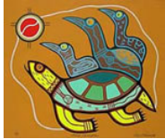
Inheemse Canadese kunst

Ondanks dit houden de 'ethische buitenaardsen zich (overeenkomstig de voorstelling van contactpersonen) aan de strenge richtlijnen van de "Galactische Gemeenschap": geen tussenkomst op de aarde, waaronder het niet uitvoeren van genetische experimenten. De exo-geleerden wijzen er echter op, dat het "graancirkel verschijnsel" een opmerkelijk voorbeeld is van in hoofdzaak "ethische Andromedanen", die trachten de mensheid te inspireren in de vorm van graancirkel boodschappen.