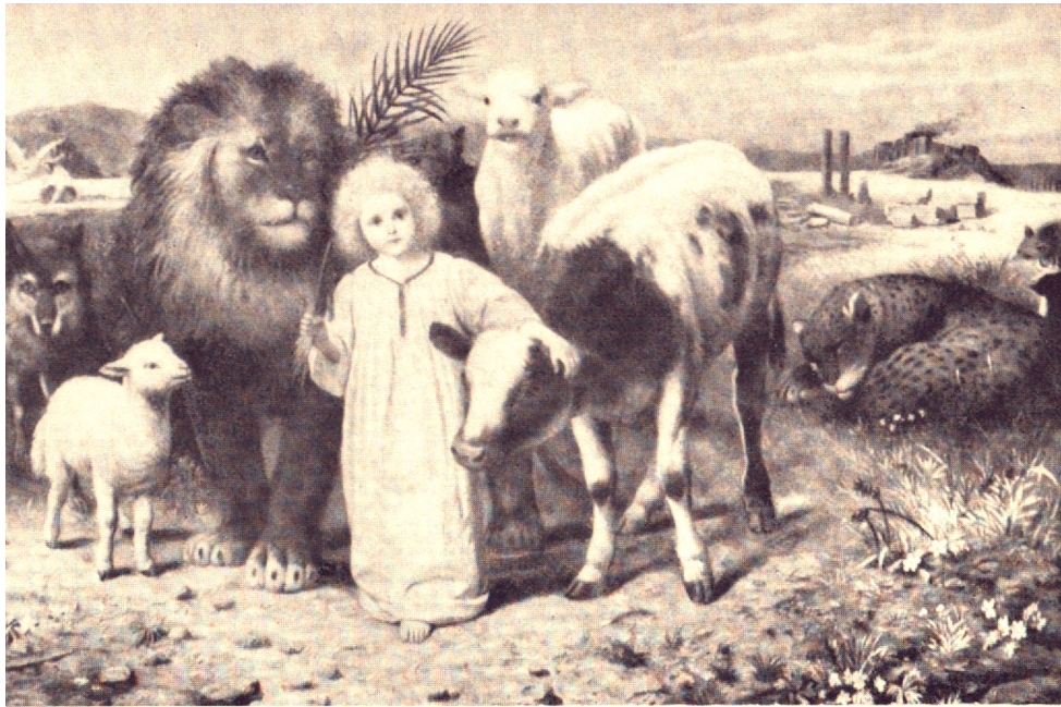
A LITTLE CHILD SHALL LEAD THEM

spirituele verlichting het met stenen bezaaide pad van het stoffelijk bestaan verlicht, ontwaakt de ziel in harmonie en vrede.