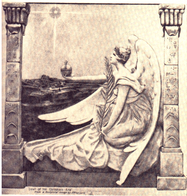
DAWN OF THE CHRISTIAN ERA

figuur, is een aanduiding van de processen van het denken en redeneren, waardoor begrip wordt verkregen.