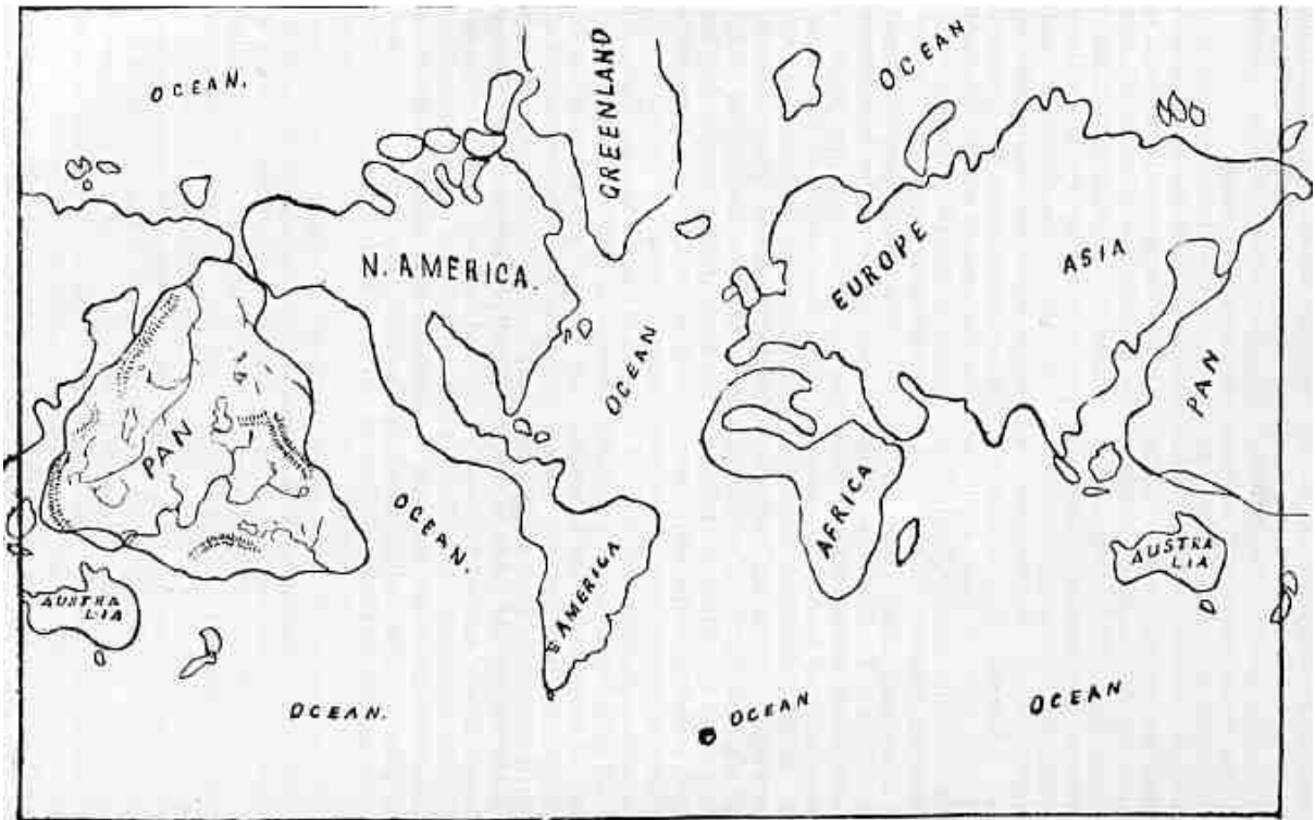
Plate 59.—OUTLINE MAP SHOWING THE LOCALITY OF PAN, THE SUBMERGED CONTINENT.

Afb. 59 Map van de Aarde met het verzonken continent Pan weergegeven.